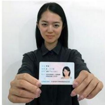
手持身份证照片示例